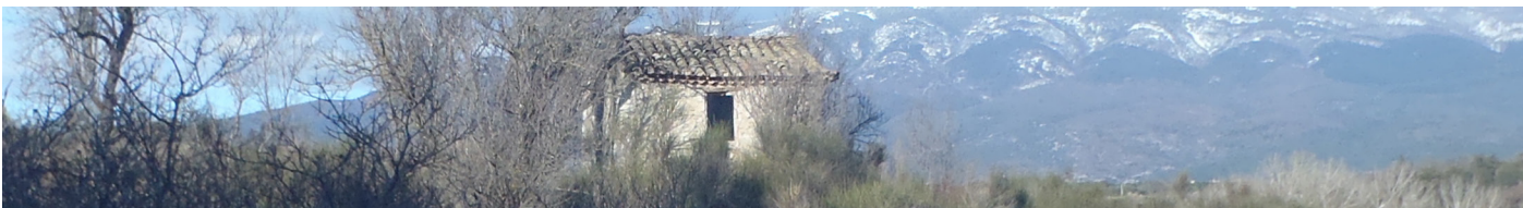
Cabanon sur fond de mont Ventoux (Archives Architecture rurale en Vaucluse / MPF84)

◀ Architecture traditionnelle en Vaucluse, une borie. Village des bories, Gordes (Archives MPF84)