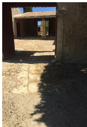
Calade achevée (détail) et vue d'ensemble du portail vers la cour.