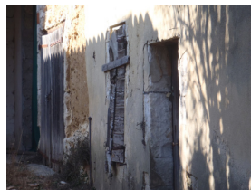
◀Façade de maison en tapy, rue des Vigneaux à Lapalud

La ville de Lapalud a renouvelé son soutien financier aux MPF. Dans sa lettre de remerciement, notre délégation a rappelé que la commune aurait intérêt à protéger son patrimoine bâti rural de terre crue (le tapy). Nous avons suggéré la réalisation d'un inventaire cartographié des maisons en terre crue, ainsi que la mise en oeuvre de règles de protection au PLU communal. Par ailleurs, si la ville avait l'ambition de valoriser ce patrimoine emblématique de la commune, d'acheter une belle de maison en terre crue, ainsi la conserver dans le but de la sauvegarder, de la restaurer et d'en faire un lieu témoin. A suivre.