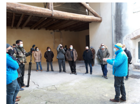
La maison Brécieux (Bd L. Faurite) qui avait fait l'objet d'un permis de démolir - Intervention du délégué de Vaucluse des MPF lors de la visite du patrimoine du village de Mondragon le mars 2021