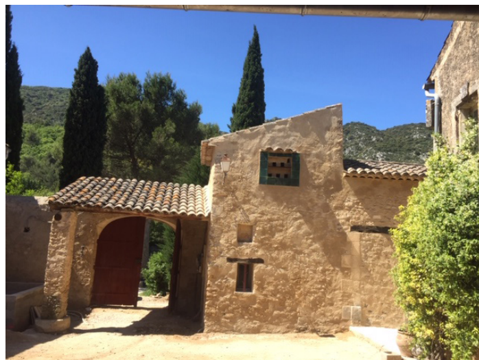
La cour de la ferme, après réalisation des enduits et avant les travaux de calade

Les MPF ont accompagné la propriétaire, notamment dans le choix des entreprises artisanales disposant des compétences et de l'expérience requises.